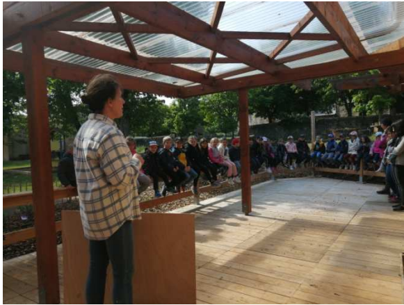
Présentation des règles de vie