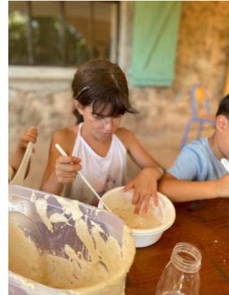
Atelier du pain aux grains