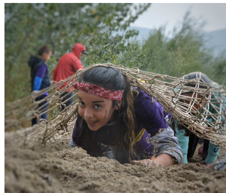
Parcours aventure – Nawack Run