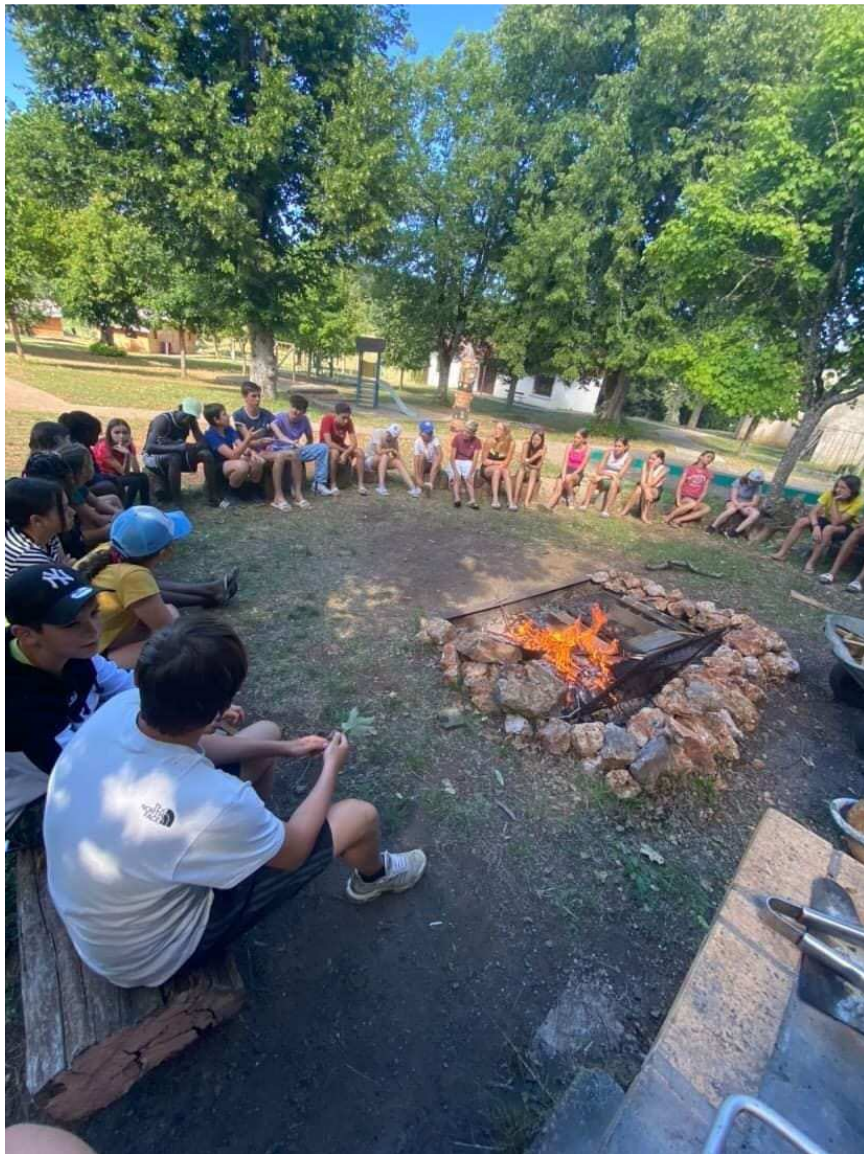
Feux de camp